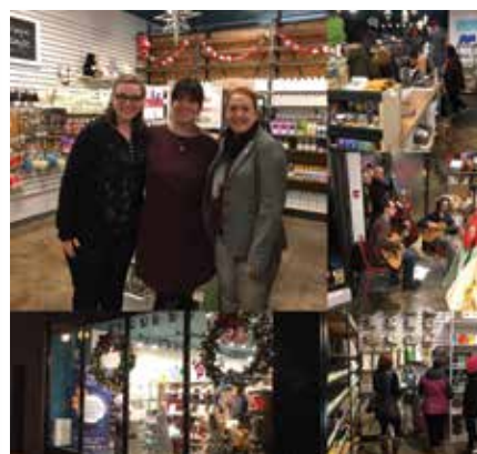
Terre à Soi