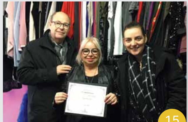
Boutique chez Carole