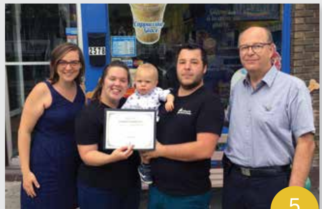
Crémerie du Bonbon Plaisir