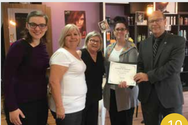
Passion Beauté Café