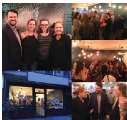
Le M Café