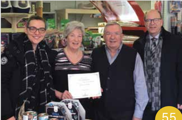
Boutique pour animaux Yvon Lewis